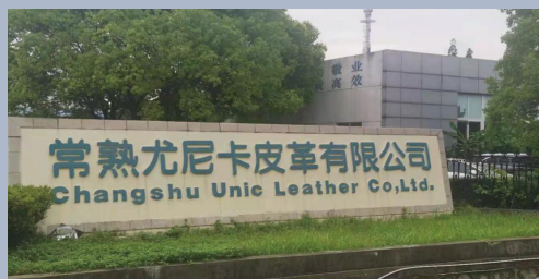
中国·常熟制造基地