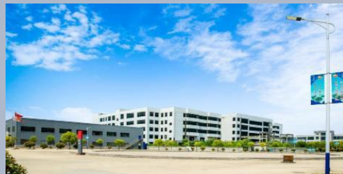
中国·南通制造基地