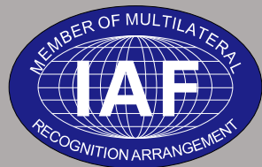
国际认可论坛(美) 检测认证