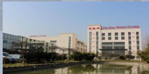
中国·昆山总部&制造工厂