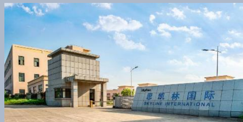
中国·商丘皮革基地