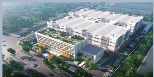
中国·唐山制造基地