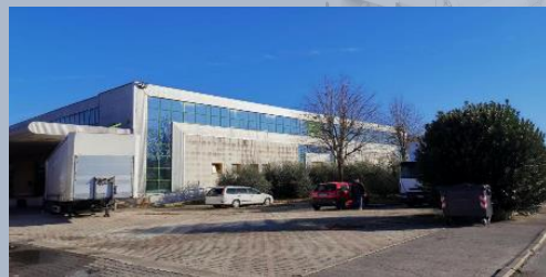
意大利·佛罗伦萨工厂